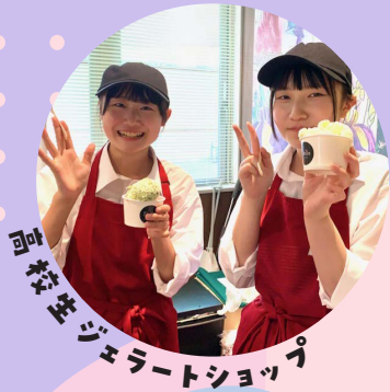
高校生ジェラートショップ